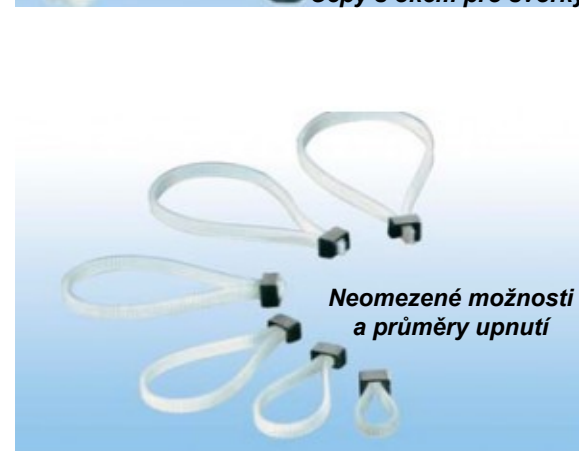
Neomezené možnosti a průměry upnutí