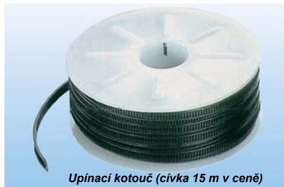
Upínací kotouč (cívka 15 m v ceně)