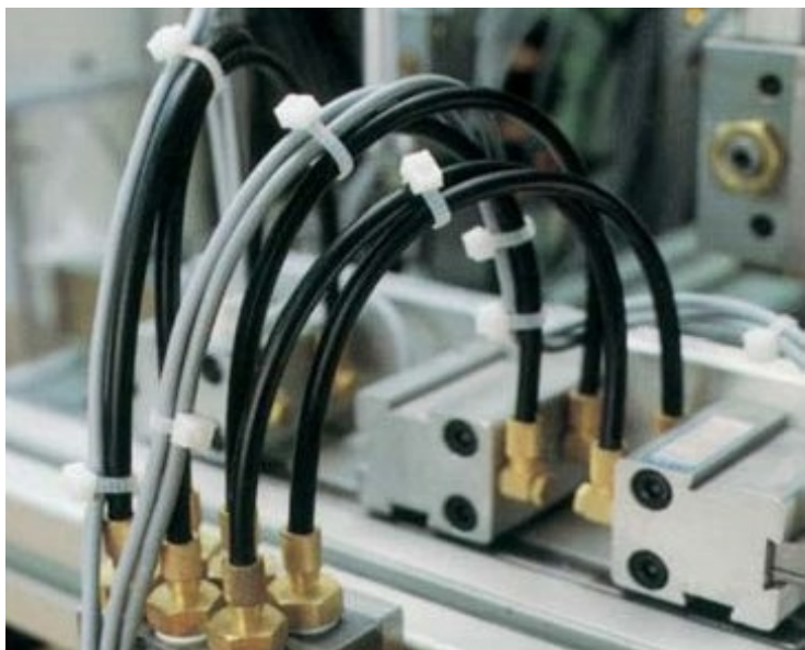
Sepnutí hydraulických hadiček