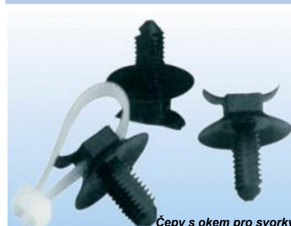
Čepy s okem pro svorky