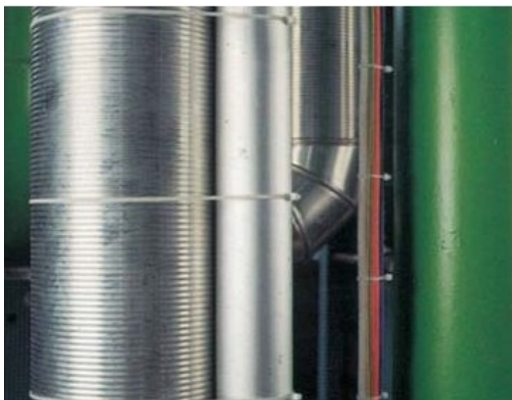
Upnutí klimatizačního vedení a vzduchotechniky